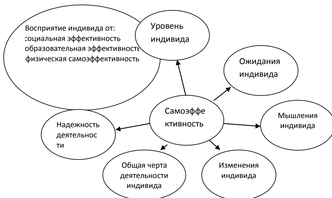
Схема № 2 Факторы влияющие на эффективность

Одной из соответствующих структур, отличающихся от самооценка, является ожидание результата. Бандура указывает на ожидания эффективности и ожидания результатов отличия. Ожидания эффективности уверенности индивида заключаются в том, что он может совершать поведения, требующие получения результата успешным образом. В то время как ожидание результата заключается в таком убеждении, что приводят ли поведения к каким-либо результатам или нет. Основные аспекты и компоненты самооценка показаны на следующей схеме.